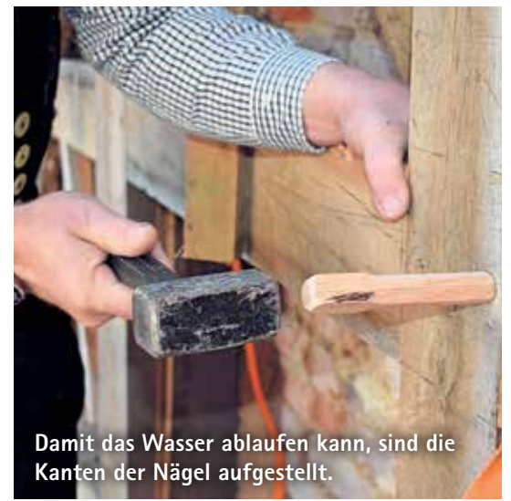
Damit das Wasser ablaufen kann, sind die Kanten der Nägel aufgestellt.

Fäulnisschäden durch stehendes Wasser kommen kann, beschreibt er. Kalkmörtel, der zum Mauern verwendet werde, unterstütze den Prozess.