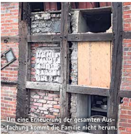
Um eine Erneuerung der gesamten Ausfachung kommt die Familie nicht herum.