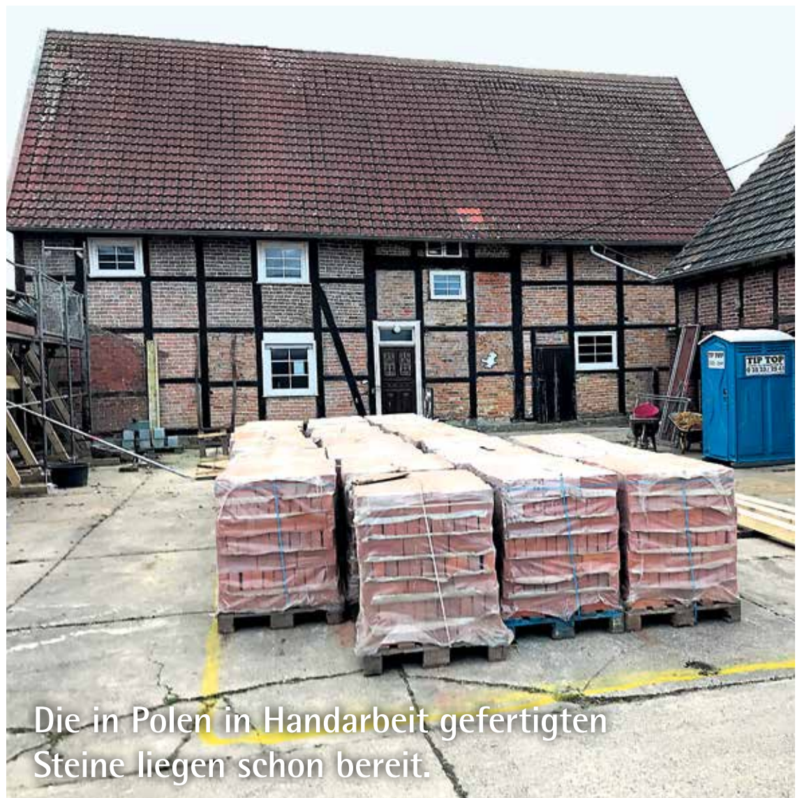
Die in Polen in Handarbeit gefertigten Steine liegen schon bereit.