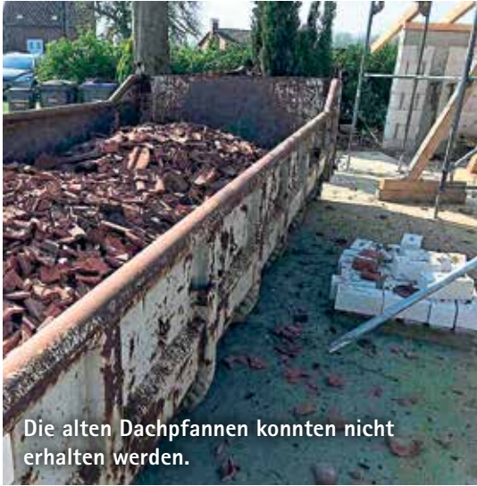
Die alten Dachpfannen konnten nicht erhalten werden.