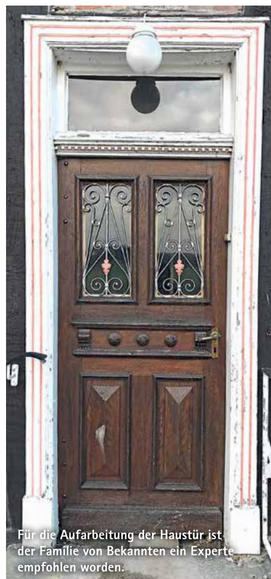
Für die Aufarbeitung der Haustür ist der Familie von Bekannten ein Experte empfohlen worden.