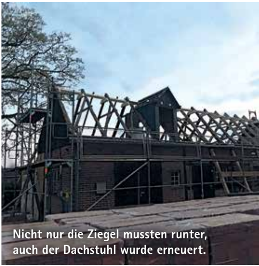
Nicht nur die Ziegel mussten runter, auch der Dachstuhl wurde erneuert.