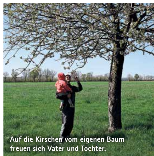
Auf die Kirschen vom eigenen Baum freuen sich Vater und Tochter.

Was den Innenausbau des Kötterhofs betrifft, hat das Paar zwar bereits einige Pläne, die sind aber in vielen Belangen noch eher unkonkret. „Wir können noch keine Fliesen aussuchen oder Sanitäreinrichtungen, weil alle Unternehmen für die Bestellung und Lieferung Termine brauchen – und die können